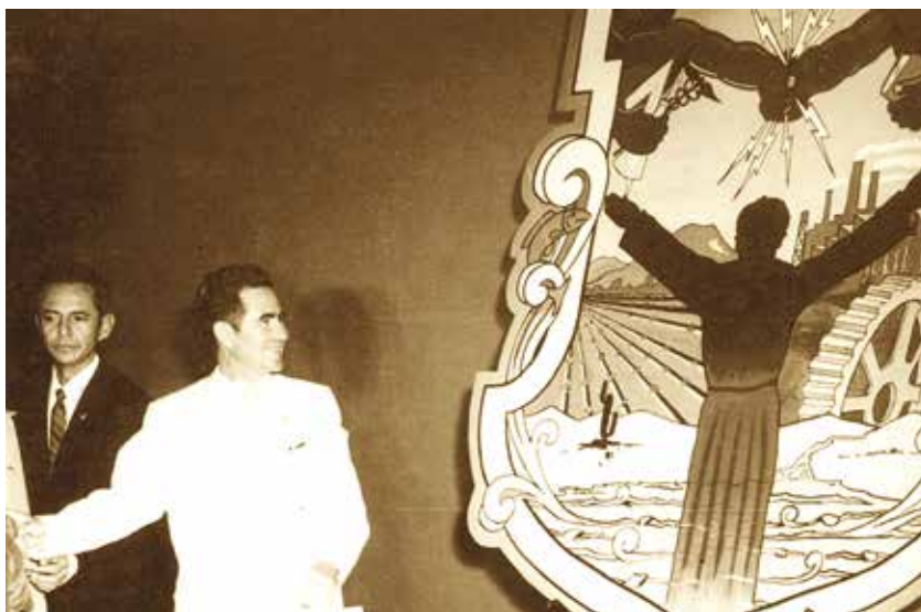
Braulio Maldonado develando el escudo del naciente estado de Baja California.