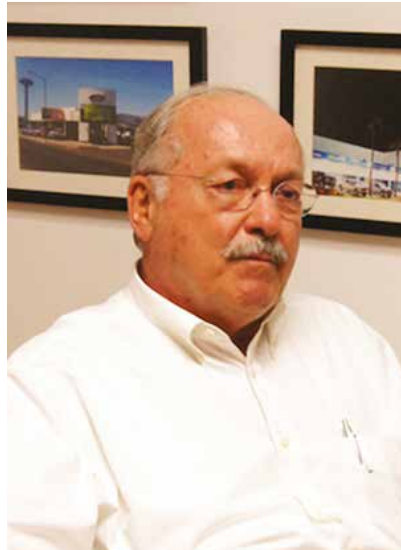
Eugenio Elorduy Walther.

ELORDUY WALTHER, EUGENIO. Gobernador Constitucional del Estado de Baja California (1 de noviembre de 2001-31 de octubre de 2007). Se ha distinguido por su larga trayectoria en el sector empresarial de Mexicali, participando en cámaras gremiales, patronatos y asociaciones, así como en iniciativas de carácter comunitario y social. Dentro de su desarrollo profesional ha sido presidente de la Comisión Industrial de Mexicali, presidente del Centro Empresarial de Mexicali (Coparmex), presidente de la Unión